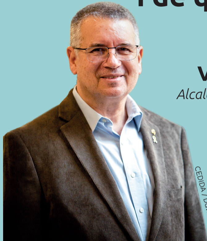
Pau Ricomà Vallhonrat Alcalde de Tarragona