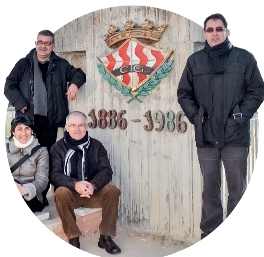
La redacció d'esports de Tarragona Ràdio ha fet, des de sempre, una aposta forta pels equips locals i pels grans esdeveniments esportius

És impossible no destacar el punt àlgid que va suposar l'ascens a Primera Divisió dels granes, durant la temporada 2005/2006, la segona vegada que s'aconseguia aquesta fita des de la dècada dels quaranta.