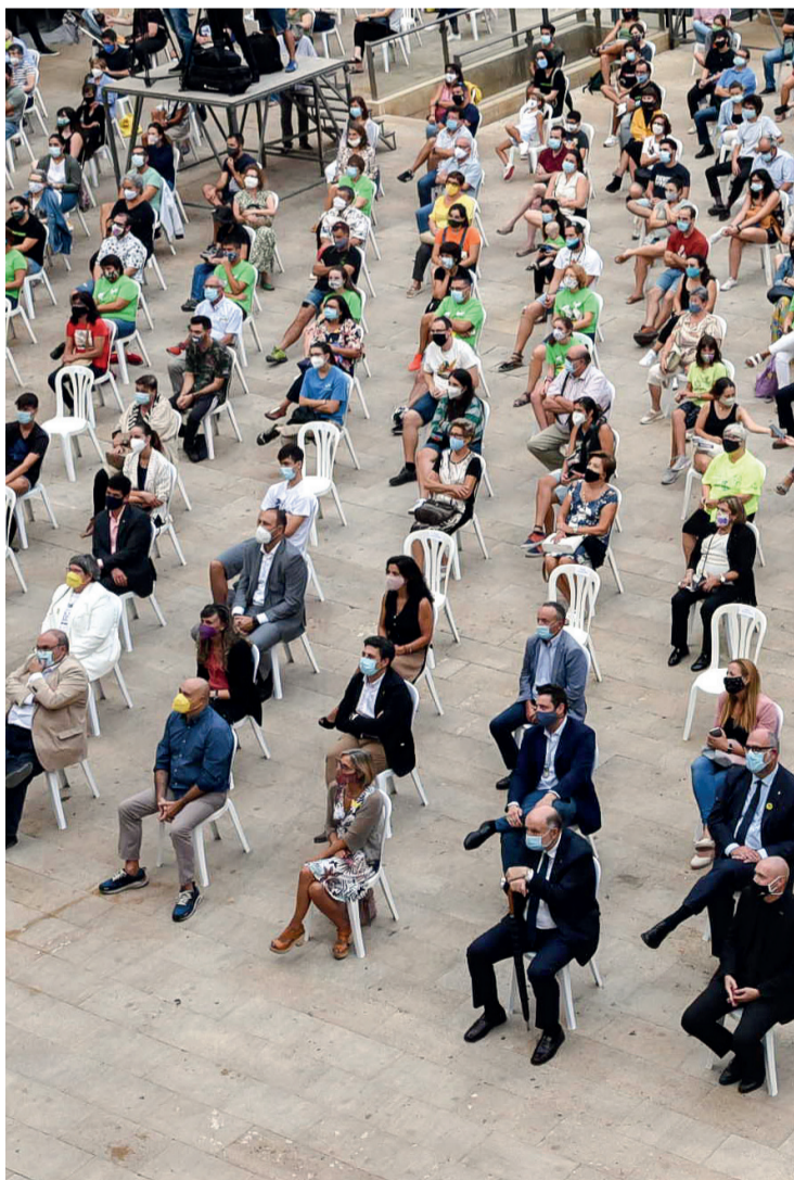
Imatge dels assistents al Pregó de Santa Tecla 2020.

D'altra banda, els treballadors de la casa reiteren la necessitat de poder garantir el nivell de treball i acostar-se a l'espectador. «Han estat uns mesos molt durs per a tots i també per a nosaltres», s'esplaià Cartañà, que afegeix que «ara el repte és el de seguir mantenint-nos a prop dels nostres oients, tot i els límits que marquen les distàncies físiques, garantir que existeix el contacte i seguir oferint proximitat». A pesar de les mascaretes, la veu de la ràdio segueix imposant-se.