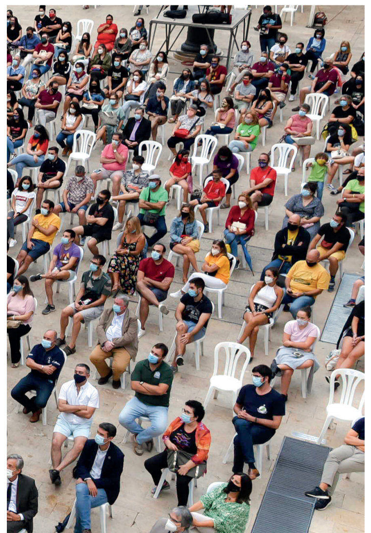
Les distàncies van marcar tots els actes de les festes.