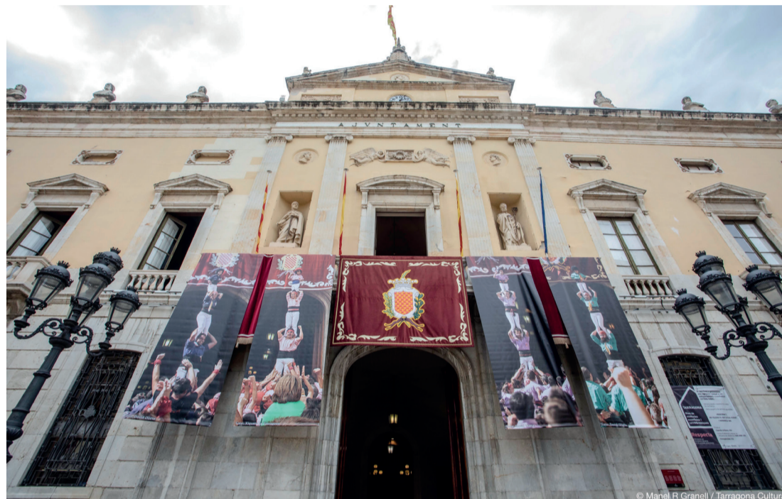
L'emissora ha estat present en grans esdeveniments que defineixen la cultura de ciutat, com les diverses edicions del Concurs de Castells.

Arribar els primers i arribar-hi sempre. Aquesta és la màxima dels professionals de Tarragona Ràdio davant dels successos que commouen la societat